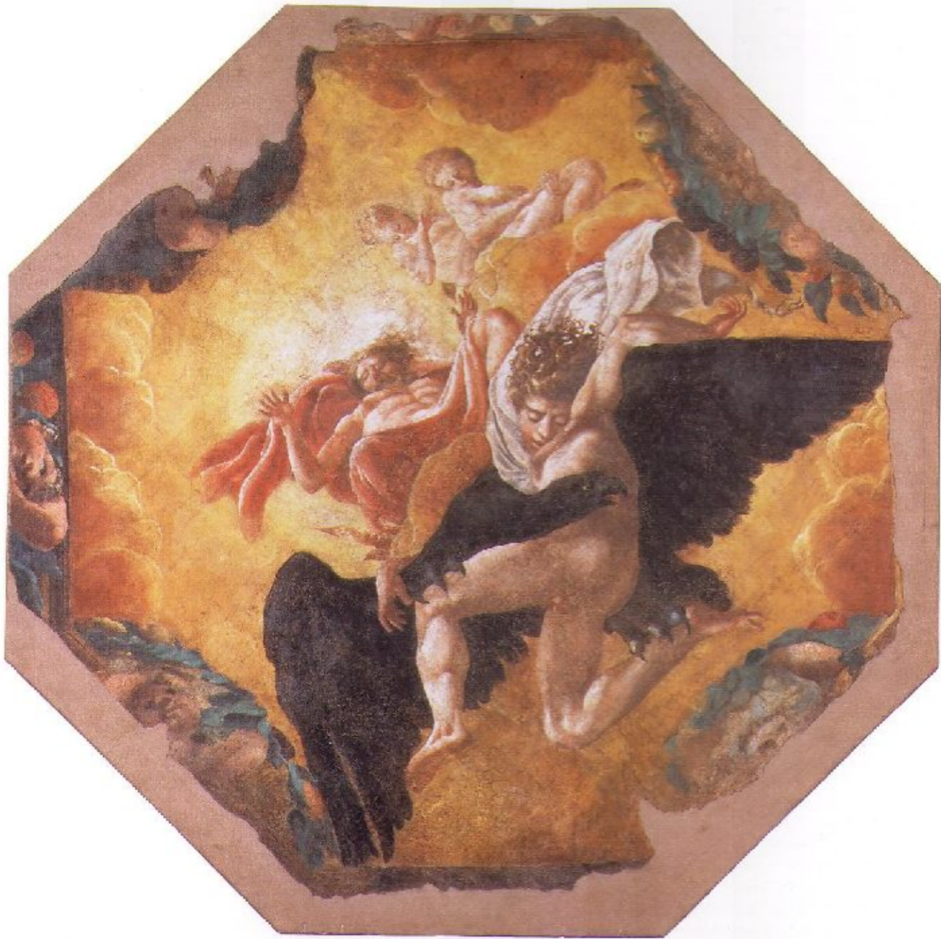
14 Leo Orsi Il ratto di Ganimede (da Michelangelo) 1546 circa Modena, Galleria Estense, inv. 51