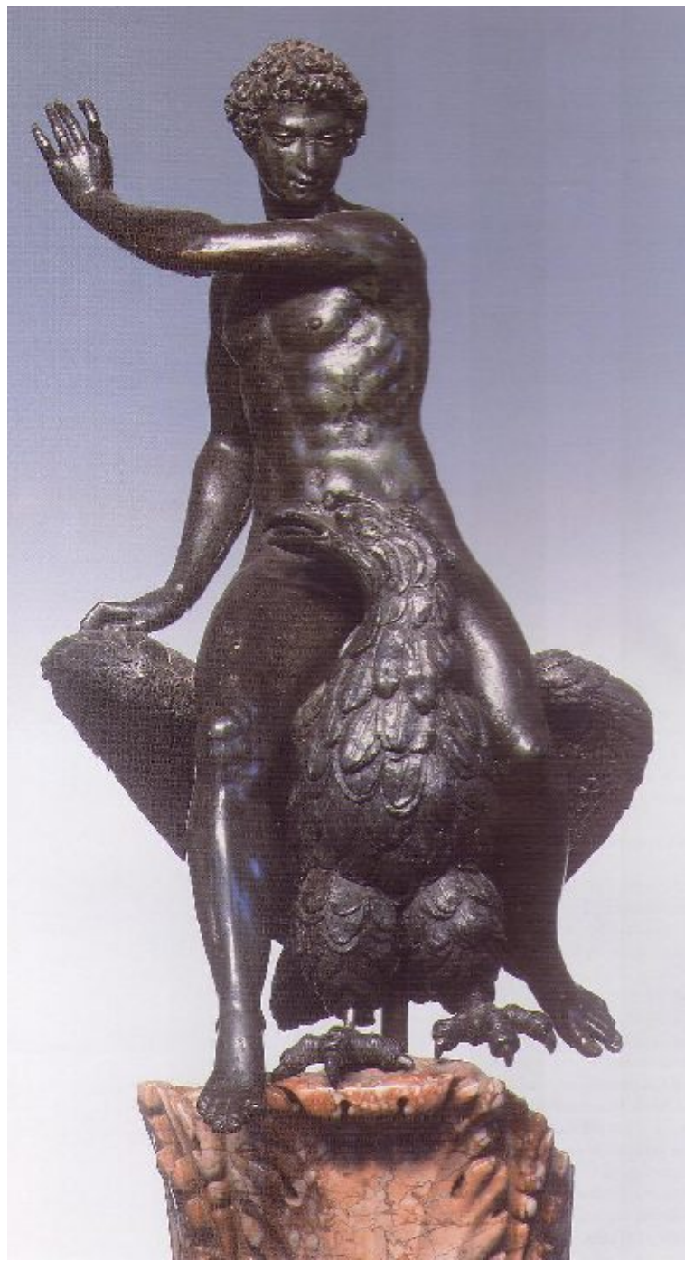
16 Tribolo, Niccolò Pericoli detto il (attr.) Ganimede e l'aquila 1540-1550 Firenze, Museo Nazionale del Bargello, inv. Bronzi n. 439