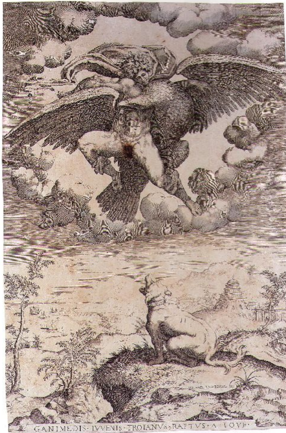
13 Incisore della metà del XVI secolo Il ratto di Ganimede (da Michelangelo) 1542 (?) Firenze, Casa Buonarroti, inv. Gallerie 1890, n. 3516