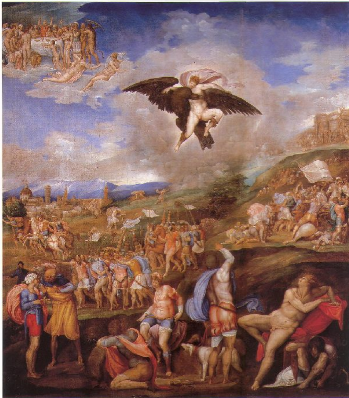
11 Battista Franco La battaglia di Montemurlo 1537 circa Firenze, Galleria Palatina, inv. 1912, n. 144