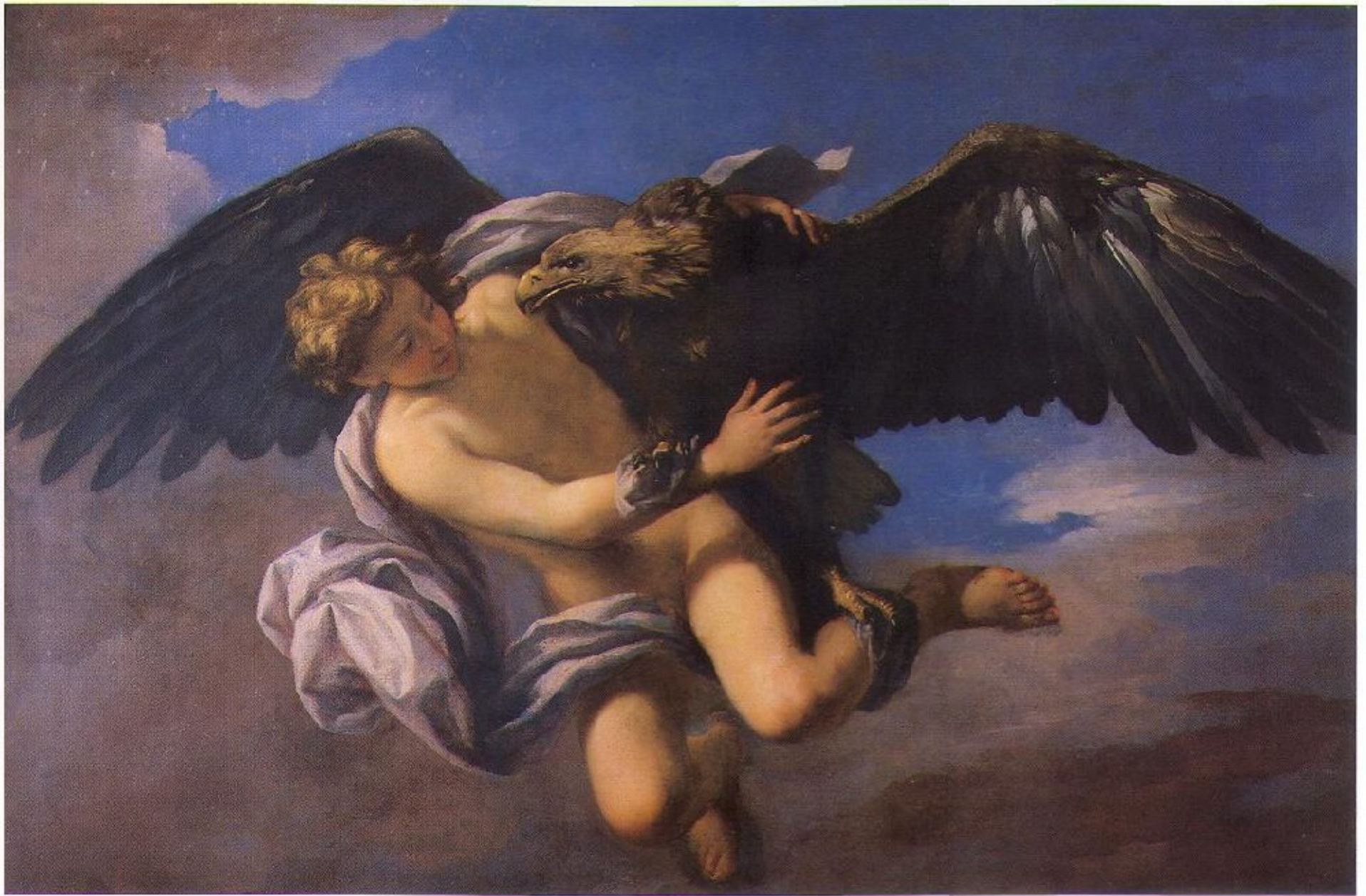
17 Anton Domenico Gabbiani Il ratto di Ganimede 1700 Firenze, Galleria degli Uffizi, inv. Gallerie n. 2176