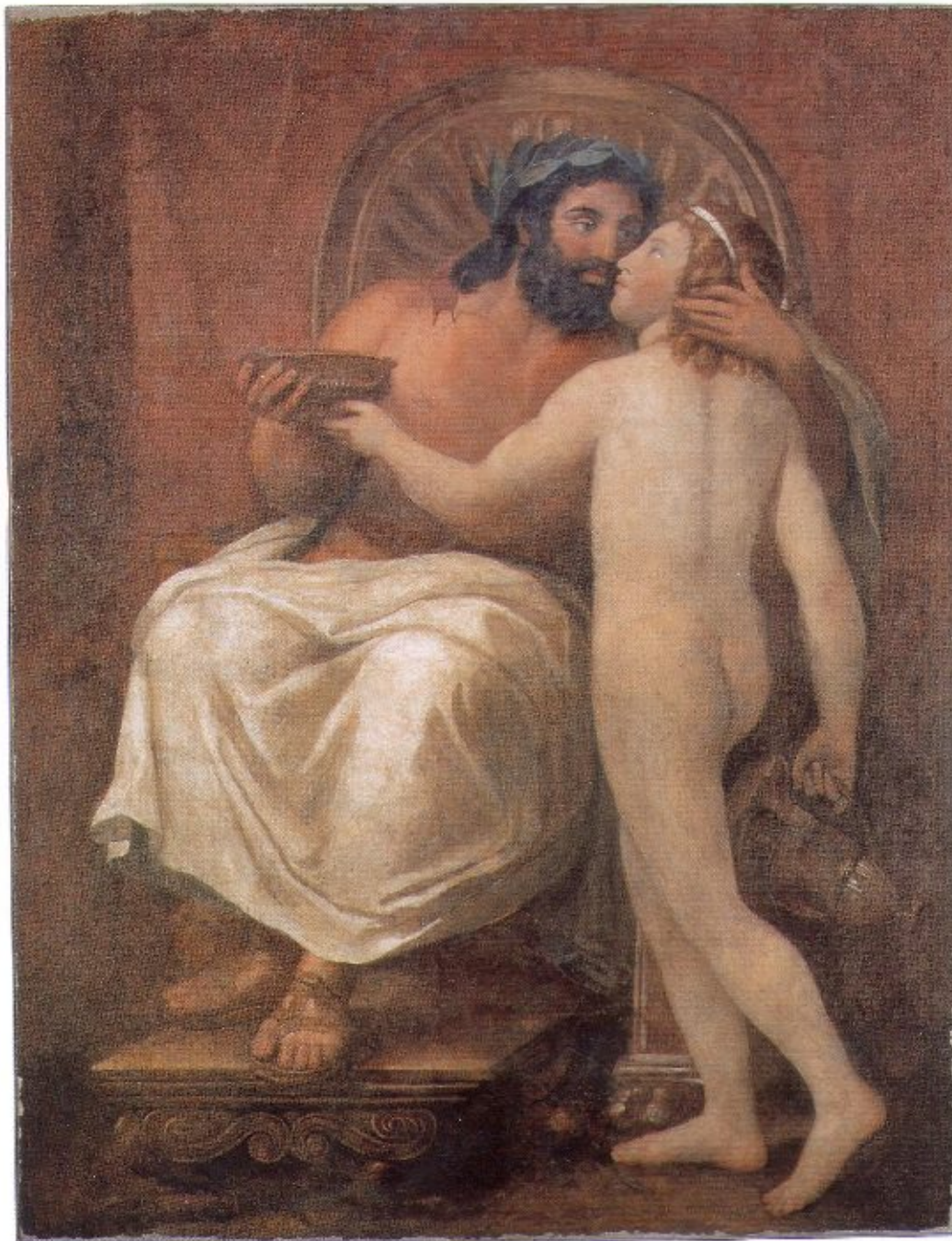
19 Anton Raphael Mengs Giove bacia Ganimede 1758 Roma, Galleria Nazionale d'Arte Antica, Palazzo Barberini, inv. 1331