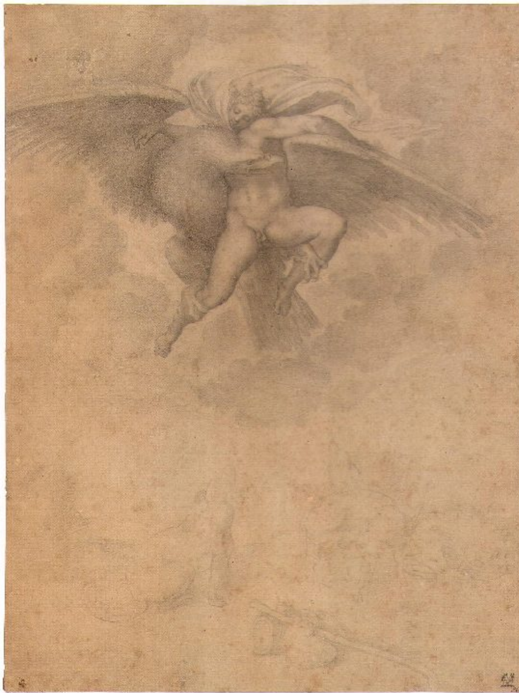
10 Michelangelo Il ratto di Ganimede 1532 Cambridge (Massachusset), Fogg Art Museum, Harvard University Art Museum, inv. 1955-75