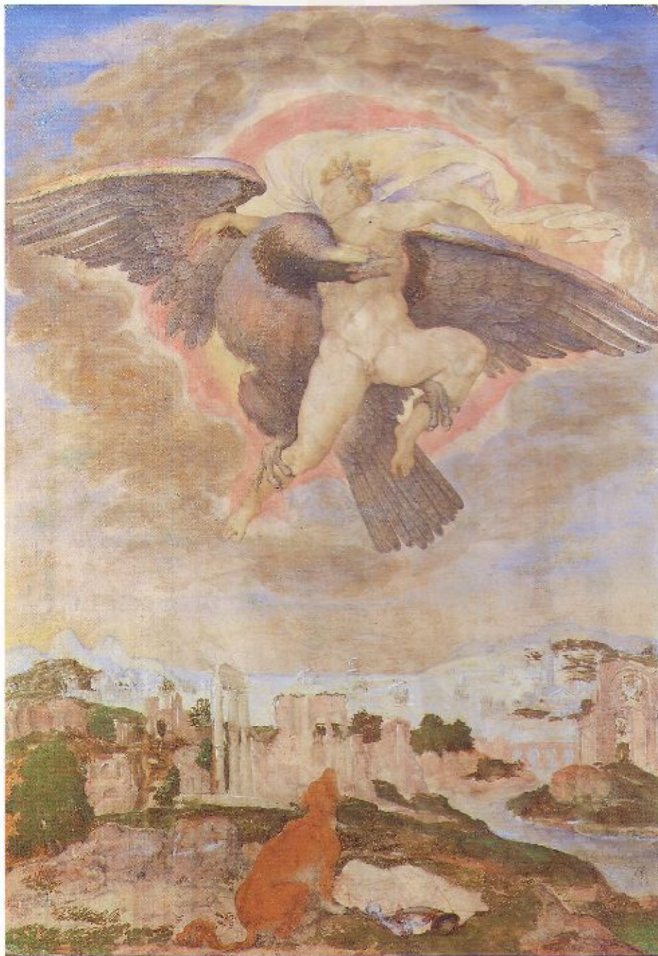
12 Giulio Clovio Il ratto di Ganimede (da Michelangelo) 1538 circa Firenze, Casa Buonarroti, inv. Gallerie 1890, n. 3516