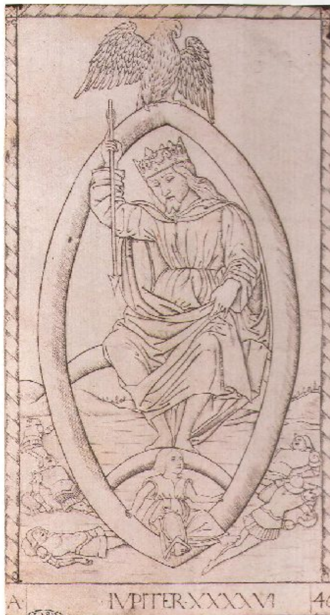
6 Artista dell'Italia settentrionale della seconda metà del XV secolo Giove (dai "Tarocchi del Mantegna") 1465 circa Firenze, Biblioteca Nazionale Centrale, Banco Rari 193